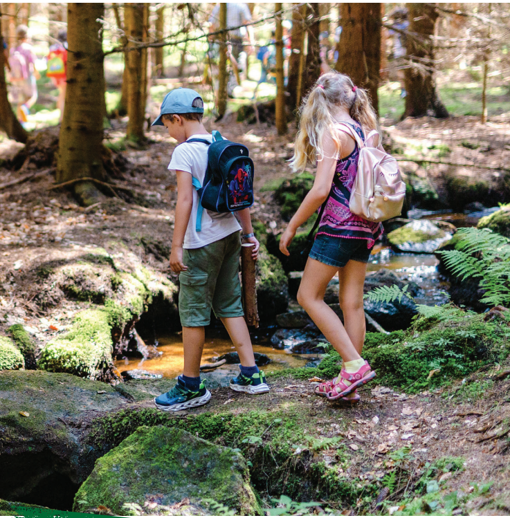
Spiel & Spass