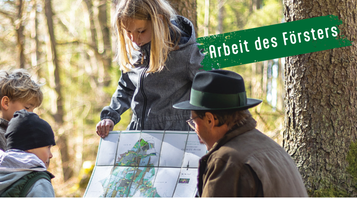
Arbeit des Försters