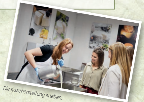
Die Käseherstellung erleben.