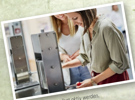
In der Schaukäseerei selbst aktiv werden.