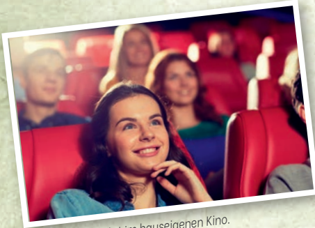
Die Führung startet im hauseigenen Kino.