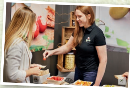
Spezialitäten von DIE KÄSEMACHER verkosten.