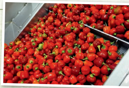
Einblicke in unsere Antipasti-Produktion erhalten.