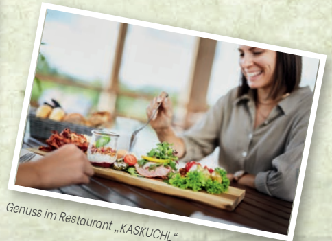
Genuss im Restaurant „ KASKUCHL “.